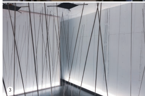
1. 小沢 智恵子 2. 篠崎 孝司 3. 伊藤 俊 ※写真は2021年開催時です